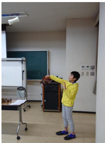
▲形の違いで飛び方も変わります▲