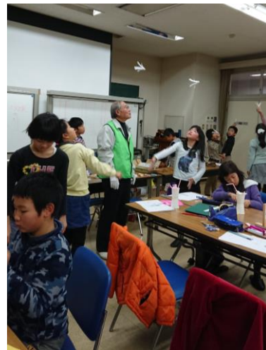
▲作った模型を飛ばします