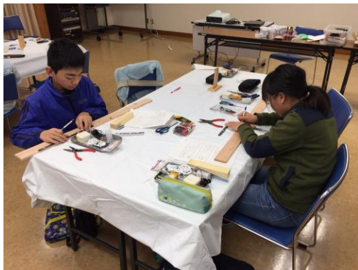
▲正しい寸法を測ります